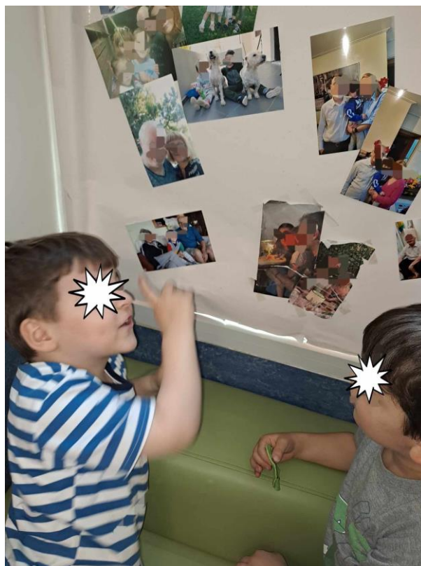
5 - όπου τοποθετήθηκαν σε σημείο που τις έβλεπαν καθημερινά και έγιναν αφορμή για συζήτηση μεταξύ τους.