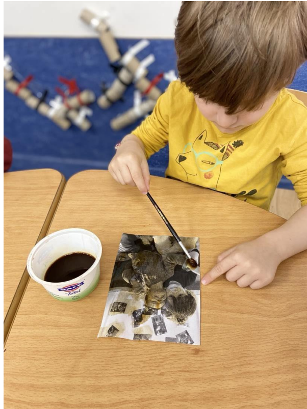
8 - Τα παιδιά με την σειρά τους έκαναν παλιές τις δικές τους φωτογραφίες...