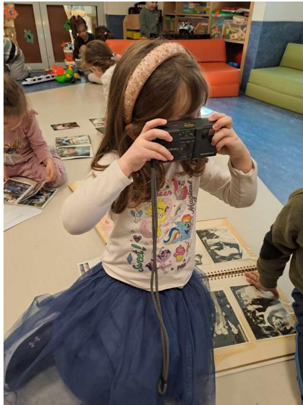
3 - Για πολλές μέρες τα παιδιά ασχολούνταν με τις κάμερες που είχαμε φέρει στην τάξη.