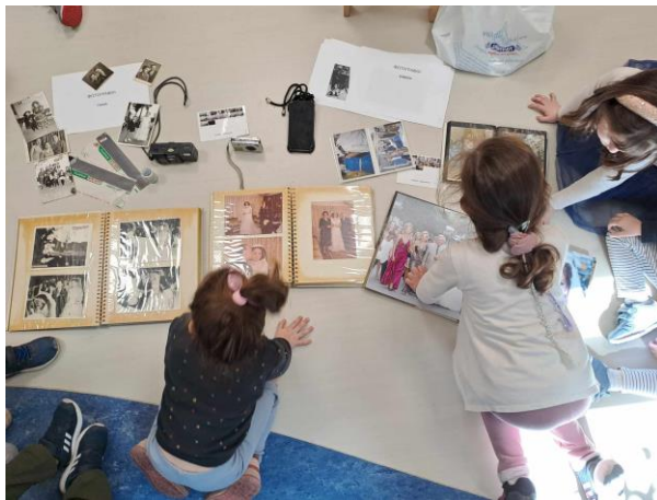
7 - Στη συνέχεια παρατηρήσαμε τις διαφορές των φωτογραφιών με την πάροδο των χρόνων και πως οι ασπρόμαυρες φωτογραφίες έγιναν έγχρωμες και πιο ζωντανές.