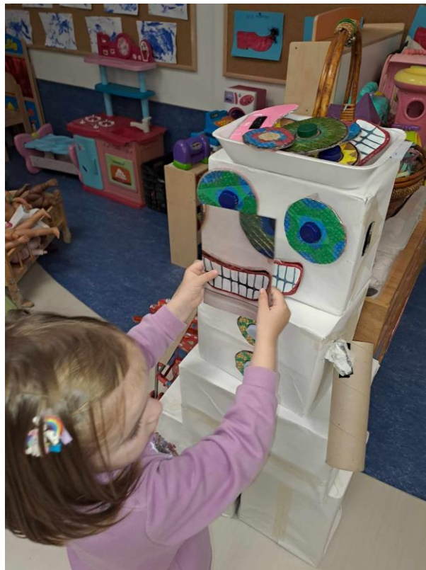
12 - Φωτογραφίσαμε σημεία της τάξης μας και τα παιδιά κρατώντας τις φωτογραφίες έψαχναν να βρουν ποιο μέρος της τάξης απεικονίζεται σε αυτές. Ξετρελάθηκαν!!