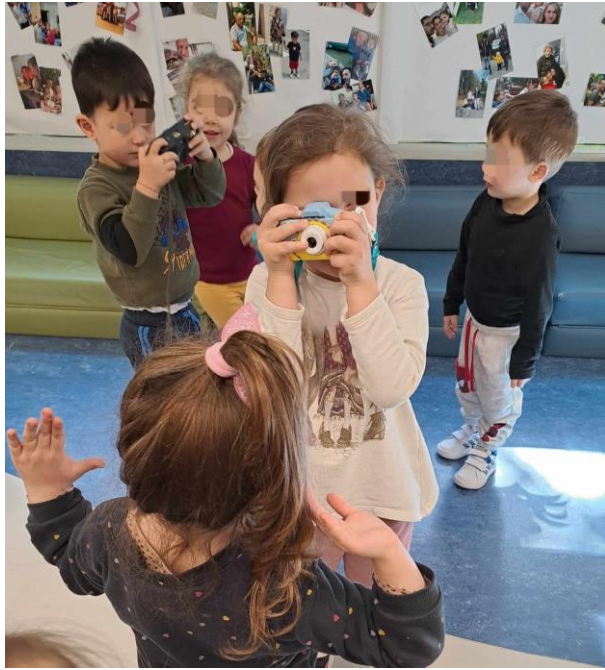
6 - Περάσαμε από την παρατήρηση της φωτογραφίας στη μίμηση των κινήσεων και των συναισθημάτων...