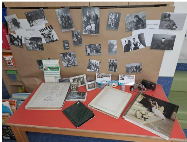
1 - Μάθαμε τι είναι το φιλμ, πως εμφανίζονταν οι φωτογραφίες, ακόμα και για την τοποθέτηση τους σε άλμπουμ.

Στη σημερινή ψηφιακή εποχή, η φωτογραφία έχει γίνει αναπόσπαστο κομμάτι της ζωής μας. Από τη στιγμή της γέννησής τους, τα παιδιά μεγαλώνουν βλέποντας τους γονείς τους να τραβούν συνεχώς φωτογραφίες με κινητά και tablets. Έτσι, η εξοικείωση με τη φωτογραφία ξεκινά από μικρή ηλικία. Η φωτογραφία επιτρέπει στα παιδιά να εκφραστούν με ελεύθερο και δημιουργικό τρόπο. Πειραματιζόμενα με διαφορετικές γωνίες λήψης, φωτισμούς, χρώματα και θέματα, αναπτύσσουν τη φαντασία τους. Μαθαίνουν πώς να μεταδίδουν συναισθήματα, ιδέες και καταστάσεις μέσα από τις εικόνες που δημιουργούν. Αυτό τους βοηθάει να εκφράζονται ολοκληρωμένα και να αυξάνουν την αυτοπεποίθησή τους. Όμως πώς ξεκίνησε η φωτογραφία; Τα παιδιά ήταν έτοιμα να μάθουν τι υπήρχε πριν το κινητό για κάμερα και πως ξεκίνησε η πρώτη φωτογραφία.