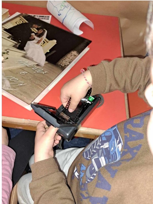
2 - Τα παιδιά εξοικειώθηκαν με τον φωτογραφικό εξοπλισμό και έμαθαν να τον χειρίζονται δημιουργικά. Αυτό τους βοήθησε να αναπτύξουν σημαντικές τεχνικές δεξιότητες.