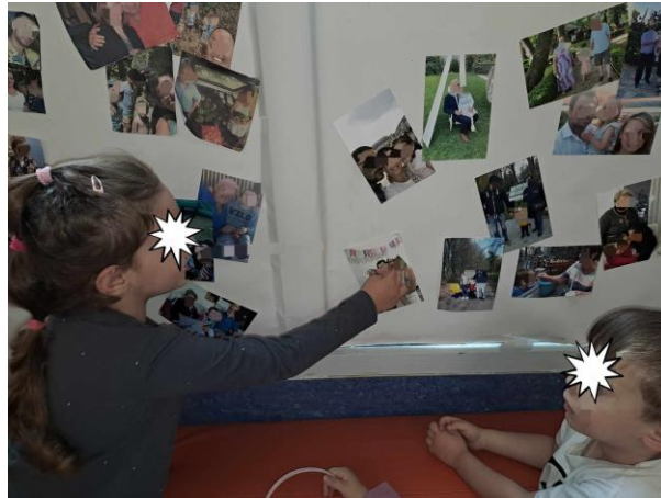
4 - Σαν αφορμή για την καλύτερη κατανόηση της αποτύπωσης μιας στιγμής σε χαρτί, τα παιδιά έφεραν το καθένα στην τάξη οικογενειακές φωτογραφίες...