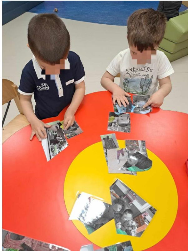
10 - Αφού φωτογραφήθηκαν όλα τα παιδιά, έκαναν παζλ με την αγαπημένη τους φωτογραφία ψάχνοντας τα υπόλοιπα κομμάτια.