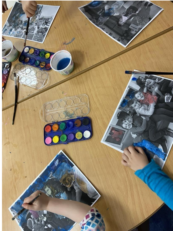
9 - και έδωσαν χρώμα σε ασπρόμαυρες... Κατάλαβαν έτσι τη δυναμική μιας φωτογραφίας.