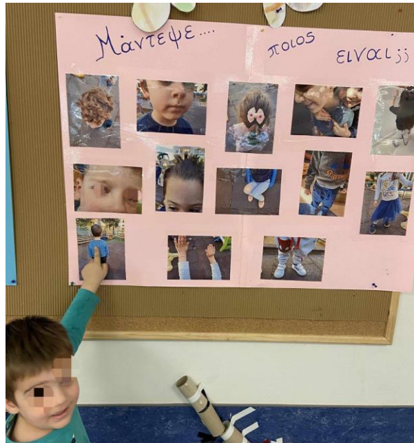
11 - Στη συνέχεια κοιτάζοντας ένα μέρος μόνο του σώματος τους προσπαθούσαν να καταλάβουν ποιο παιδί απεικονίζεται στη φωτογραφία.