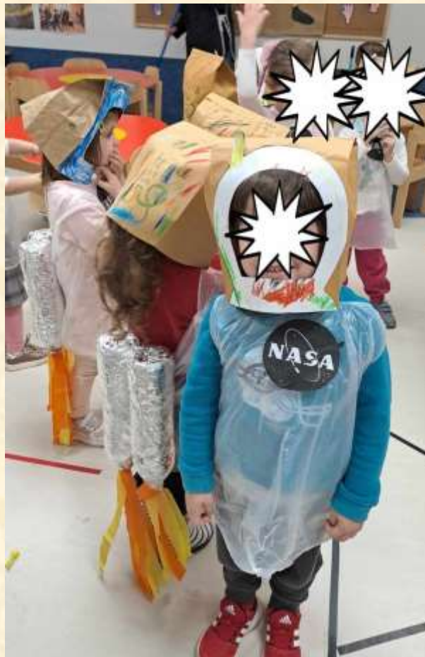
2 - Αποκρίτικες στολές αστροναύτη