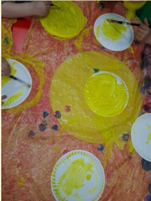
3 - Πασχαλινές δημιουργίες