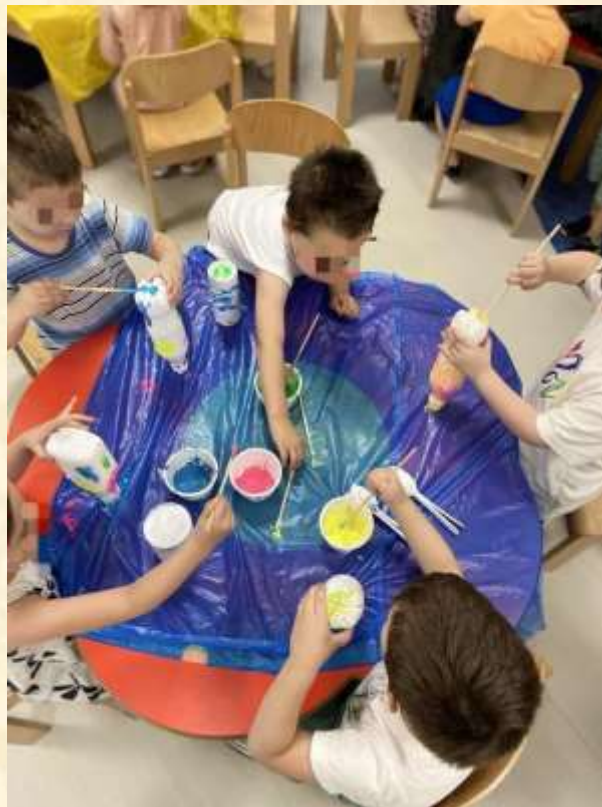
1 - Μουσικά όργανα