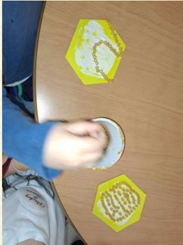
4 - ανοιξιάτικες ....