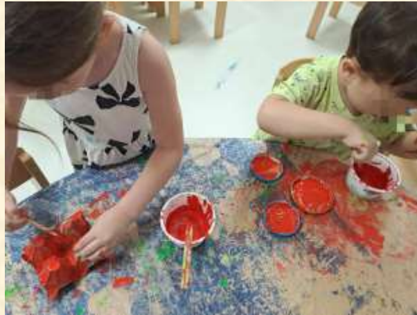
5 - αλλά και καλοκαιρινές